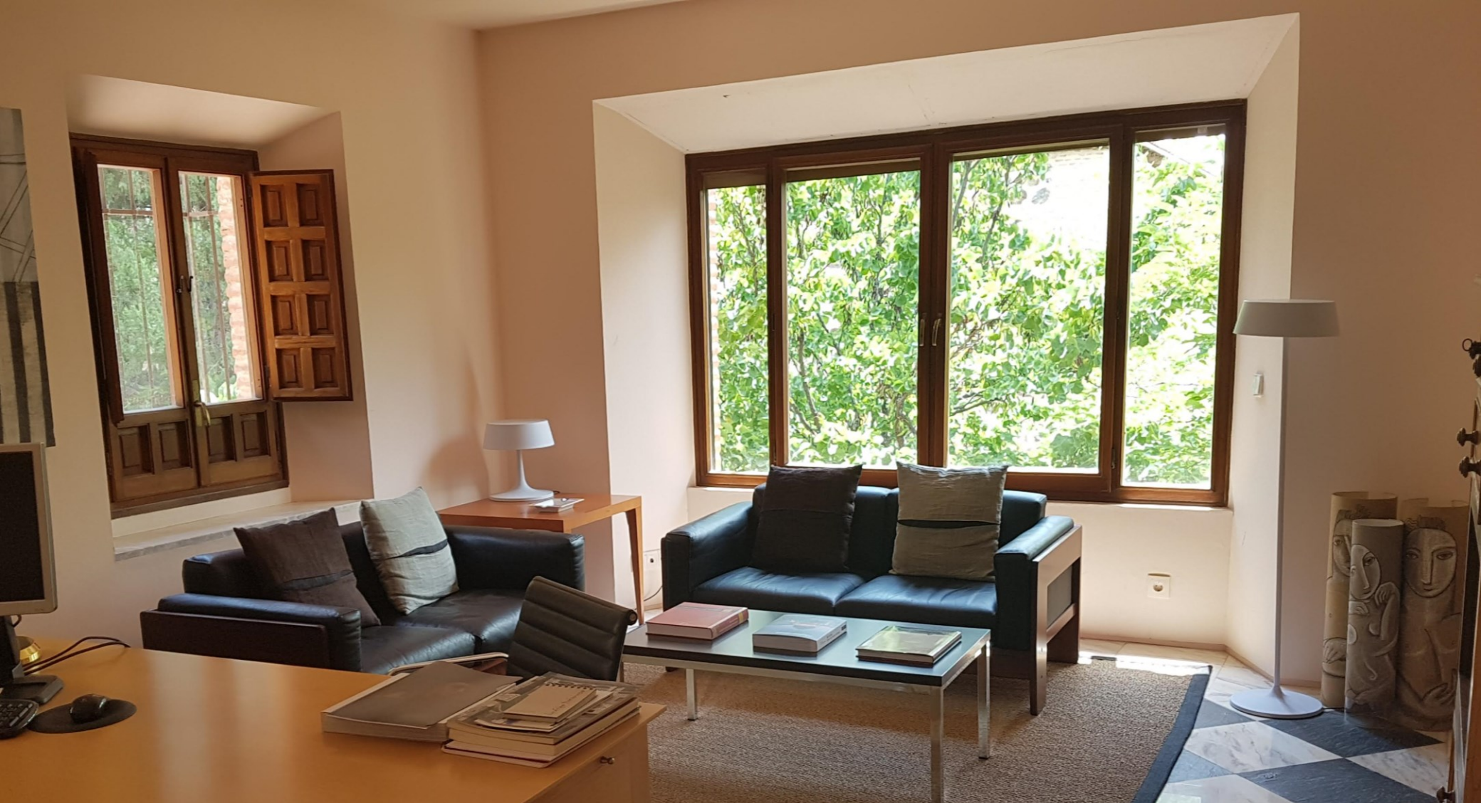
DESPACHO DE DIRECCIÓN